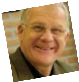
Président de Portes Ouvertes International, accompagné de son épouse